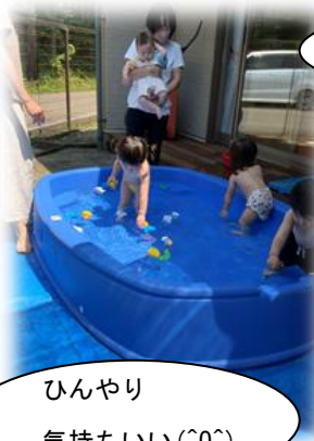
ひんやり 気持ちいい(^o^)