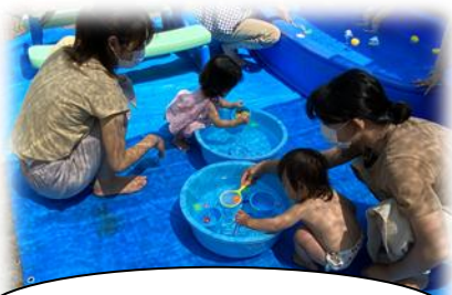
魚すくいにチャレンジ！