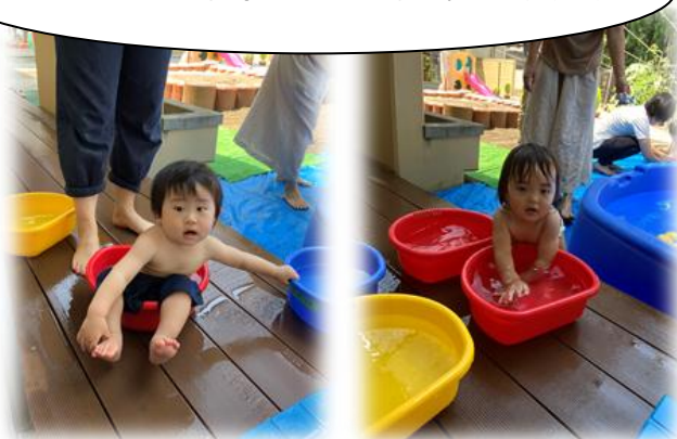
おひとり様専用タイ♪落ち着きます(*^^)v