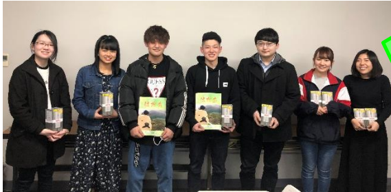
記念アルバム・記念品を持つ 成人式実行委員の皆さん

29日、成人式終了後から成人式実行委員12名が作成した記念アルバムが完成しました。記念アルバムは、成人式で撮影した写真を実行委員が一枚一枚選出して作成したものです。完成した記念アルバムは、成人式出席者（内購入者）へ郵送しました。また、川崎町から実行委員に記念品を配布しました。今年度も成人式実行委員を募集します。興味のある方は、生涯学習課までお問合せ下さい。