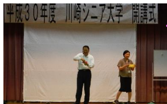
昨年度の第1回 学習会の様子